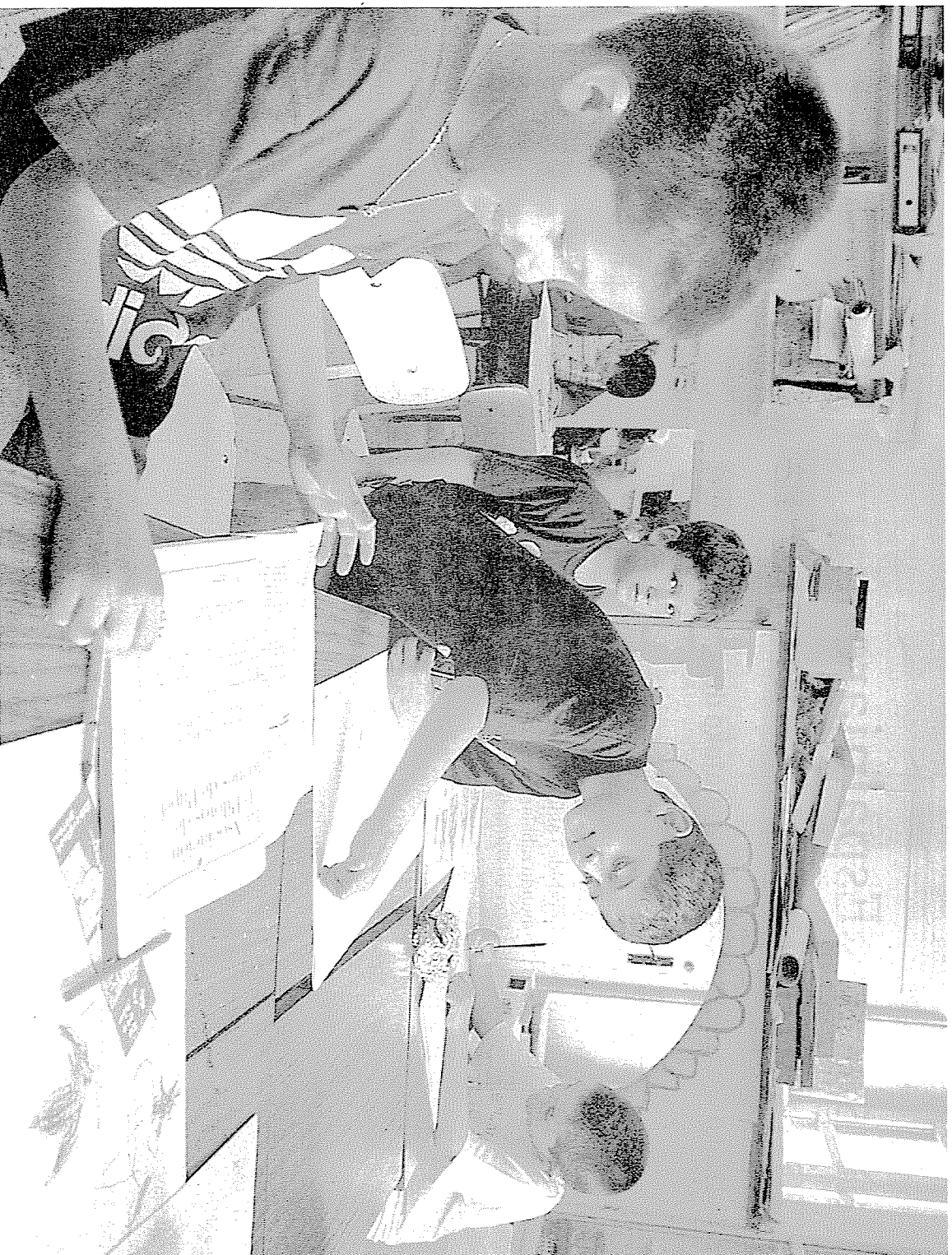
GUZTIRA 80 eskola liburu aztertu dituzte. 13.310 orri irakurri eta 22.238 ikono neurtu, kokatu eta deskribatu dituzte. Eskola liburuetan Euskal Herria, «entitate sozio-kultural moduan» ez dela ardatza ondorioztatu dute.

Hala ere, oraindik gehiago mugatu behar izan zuten euren ikerketa eremua, eta 11-12 urterako ikasleek erabiltzen dituzten u